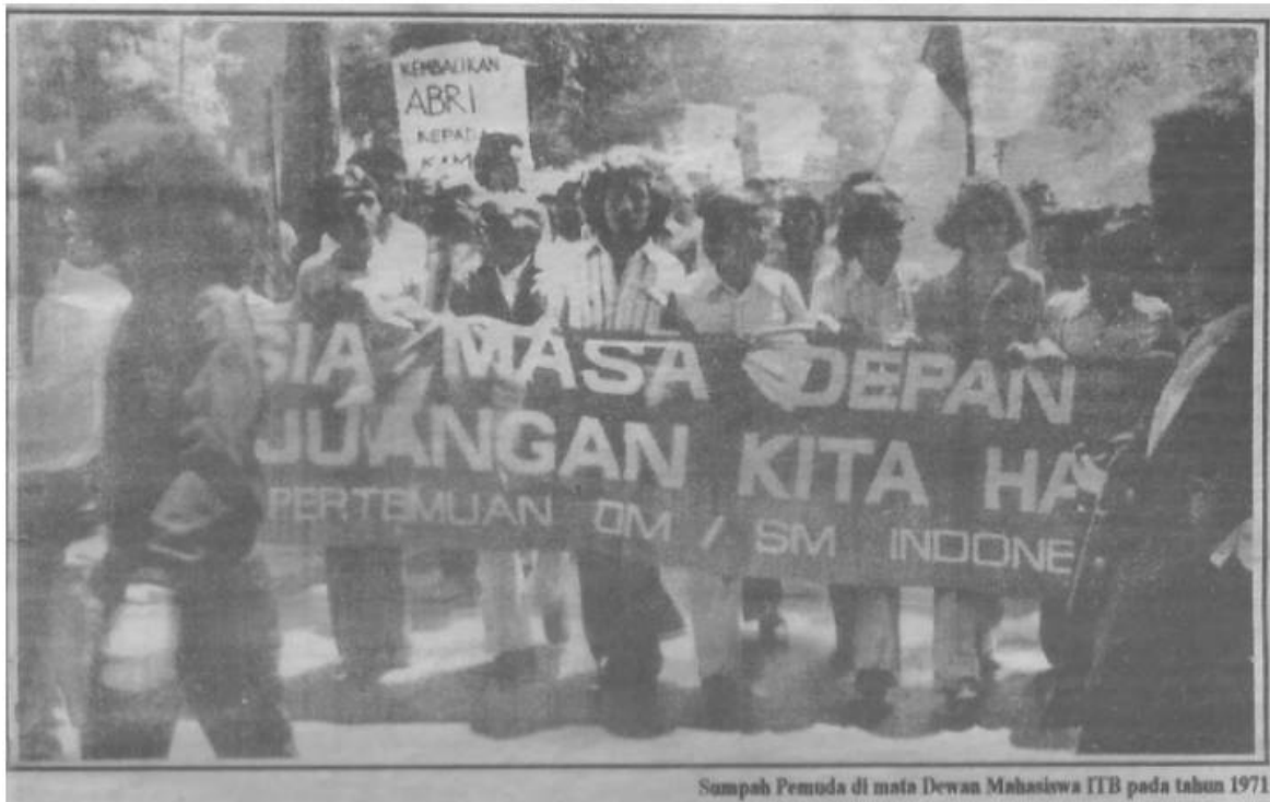
Gambar utama pada halaman depan arsip tabloid Boulevard edisi IV, Februari 1994, yang menyiratkan salah satu cuplikan sejarah terkait perayaan sumpah pemuda oleh DEMA pada 1971